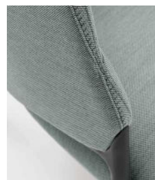
Cucitura "punto sella"