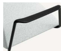
Braccioli chiusi in alluminio