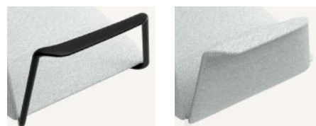
Braccioli chiusi in alluminio